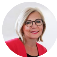
Eliška Olšáková, předsedkyně SMS ČR a poslankyně PČR

Jen v našem mikroregionu jsme mohli přijít o stavební úřad v Němčicích nad Hanou! I vedení tohoto města a zástupci mikroregionu se před dvěma roky jednoznačně a aktivně připojili k výzvě SMS ČR proti rušení stavebních úřadů. A povedlo se! Stavební úřad zůstane zachován! A to nejen v mikroregionu Němčicko.