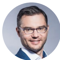
Stanislav Polčák, čestný předseda SMS ČR a europoslanec

Ve Sněmovně máme dobojováno! Závěrečné čtení stavebního zákona je za námi a já jsem opravdu ráda, že novela prošla hlasy napříč celým spektrem. Co je stručně obsahem novely? Stavební úřady se rušit nebudou, nebude se přecházet na centrální model, dále bude zajištěna dostupnost pro občany a zaměstnanci stavebních odborů se nebudou muset rozhodovat, zda si mají hledat novou práci nebo akceptovat nového zaměstnavatele.