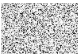
Za správnost: ..... Sklenářová Zdeňka