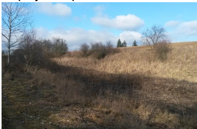
Nad Jestřabským rybníčkem před stavbou