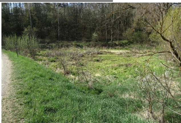
Zátopa rybníčku před realizací