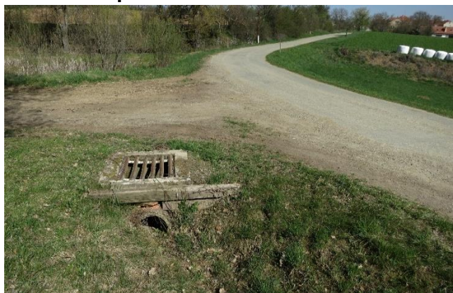
Hráž a odpadní šachta před realizací