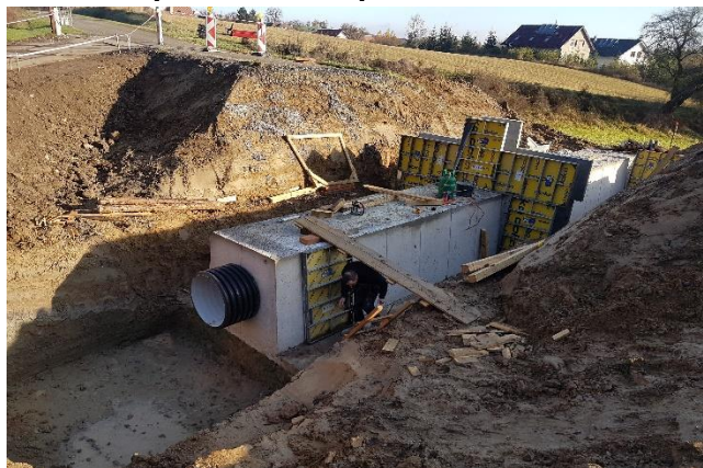
Betonáž vypustného objektu