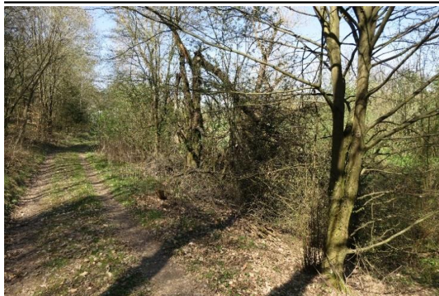
Cesta C13 před realizací