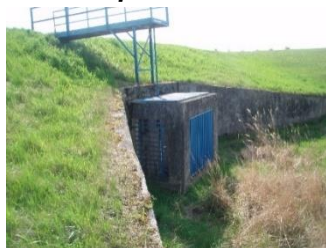
Poldr III před realizací