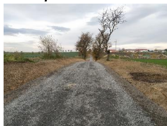
VPC 4 po realizaci