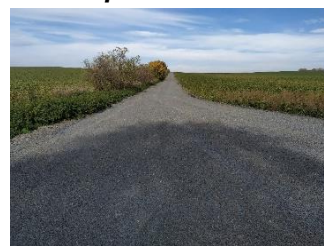
HPC 1 po realizaci