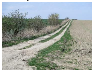
HPC 1 před realizací