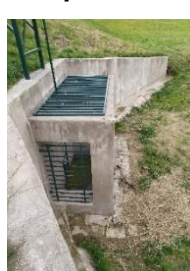
Poldr III po realizaci