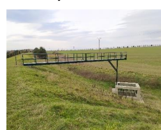
Poldr IV po realizaci