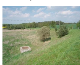
Poldr IV před realizací