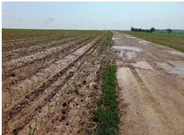
Cesta HC5 před realizací