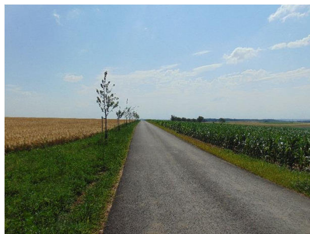
Cesta HC5 po realizaci