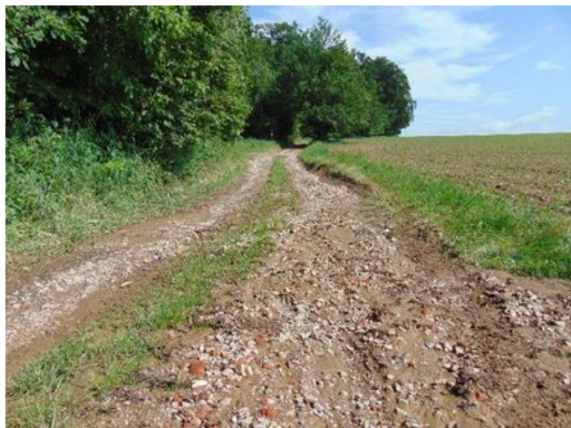
Cesta HC6 před realizací