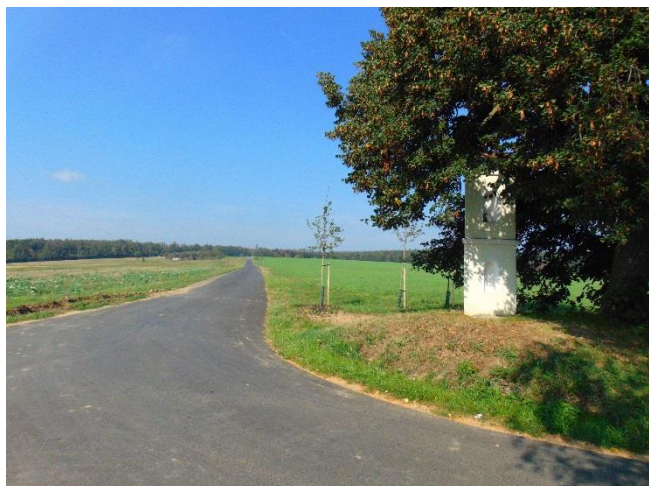
Křižovatka cest HC4 a HC5