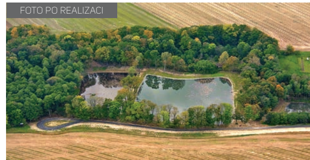
FOTO PO REALIZACI

V roce 2015 jsme postavili polní komunikaci s mostem a vysázeli lokální biokoridor v rámci plánu společných zařízení.