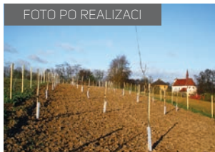
FOTO PO REALIZACI