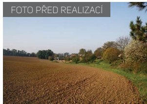
LBK 59 část EZ 2 před realizací a po ní