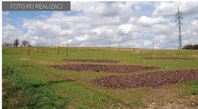
FOTO PO REALIZACI

Zasakovací pás funguje v Klimkovicích jako protierozní opatření. Vzhledem k blízkosti komunikace k Lázním Klimkovice slouží pás částečně i jako park. Vysázeli jsme tu solitérní stromy, rabata a vytvořili systém drobných přehrázek a tůňek k zadržení vody a smyvů z polí.