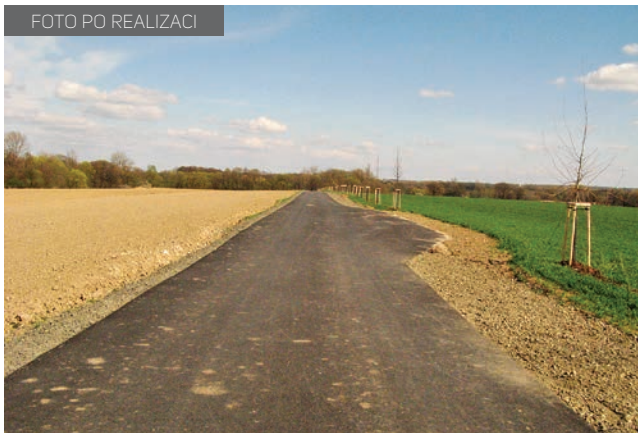
FOTO PO REALIZACI

Nová polní cesta ve Slezských Pavlovicích umožňuje přístup od zemědělského areálu k Pavlovickému rybníku a na další pozemky. Podél cesty jsme vysadili 122 listnatých stromů a 550 keřů. Polní cesta je začleněná do krajiny, je z asfaltobetonu a má jeden pruh. Měří 2190 metrů a je 4 metry široká bez zpevněných okrajů. Odvodnění zajišťuje podélný a příčný sklon do drenáží a odvodňovacích žlabů. Na cestě jsou také 4 výhybny pro projíždějící stroje.