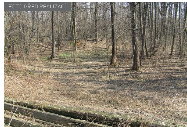
FOTO PŘED REALIZACÍ

Výstavbou krajinotvorné nádrže Mušalec jsme obnovili systém propojených rybníků. Vytvořili jsme retenční prostor, který výrazně sníží průběh a následky povodňové vlny. Nádrž také zvyšuje zásoby podzemní vody a zlepšuje protierozní ochranu. V industriální obci díky ní vznikla krásná relaxační zóna.