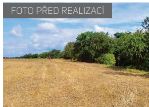
LBK 59 část EZ 1 před realizací a po ní