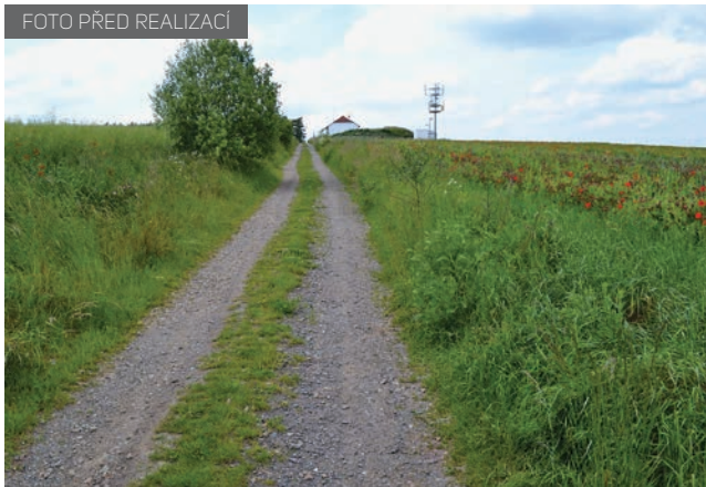
FOTO PŘED REALIZACÍ

Polní cesty v katastrálním území Pavlíkov jsme postavili po komplexních pozemkových úpravách a zpřístupnili jsme tak přilehlé zemědělské pozemky a blízké lesy. Opravou cest jsme také zkvalitnili přístup k nové rozhledně na Senecké hoře. Celkově jsme vylepšili propustnost a orientaci v krajině a ekologickou a protierozní ochranu území. První cesta HPC 18 je 3,5 metru široká a 718 metrů dlouhá. Druhá HPC 35 měří 3 metry na šířku a 542 metrů na délku. Obě jsme zpevnili asfaltobetonovým povrchem.