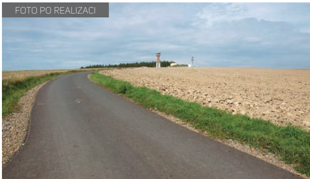
FOTO PO REALIZACI

Polní cesty v katastrálním území Pavlíkov jsme postavili po komplexních pozemkových úpravách a zpřístupnili jsme tak přilehlé zemědělské pozemky a blízké lesy. Opravou cest jsme také zkvalitnili přístup k nové rozhledně na Senecké hoře. Celkově jsme vylepšili propustnost a orientaci v krajině a ekologickou a protierozní ochranu území. První cesta HPC 18 je 3,5 metru široká a 718 metrů dlouhá. Druhá HPC 35 měří 3 metry na šířku a 542 metrů na délku. Obě jsme zpevnili asfaltobetonovým povrchem.