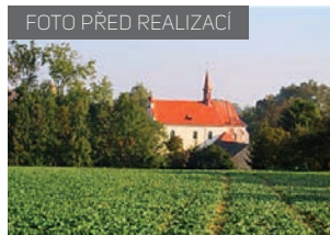
LBK 59 část EZ 4 před realizací a po ní