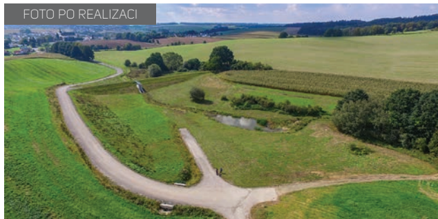
FOTO PO REALIZACI

V Hatí jsme postavili poslední a největší ze 4 plánovaných suchých poldrů a zlepšili tak protipovodňovou ochranu obce. Nádrž při přívalových deštích zachytí přebytečnou vodu a zmírní tak jejich důsledky. Zbytek zvládne obecní kanalizační síť.